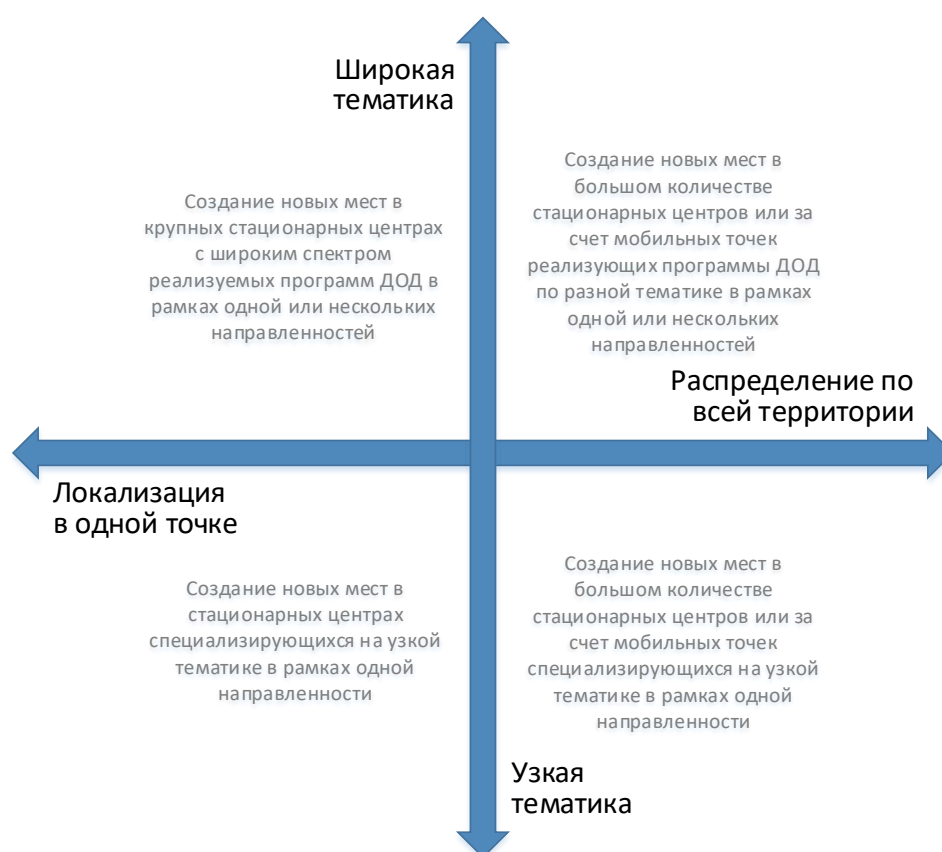
Рис. 3. Шкалы выбора масштаба и формы реализации новых мест по программам ДОД

При невыполнении хотя бы одного из них возникает необходимость пространственного распределения реализуемой модели через мобильные или сетевые решения. В регионе с большой площадью и/или плохой логистикой невозможно обеспечить очный доступ к услугам данной модели для всех желающих, за исключением программ с использованием дистанционных технологий. В регионе с низкой плотностью населения вложения в такой масштабный по материально-техническому оснащению проект принесут очень низкую отдачу.