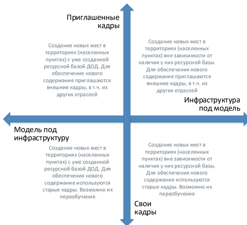
Рис. 6. Шкалы выбора модели инфраструктурного и кадрового обеспечения для типовой модели создания новых мест дополнительного образования

Следует отметить, что механизмы инфраструктурного и кадрового обеспечения не существуют в их полярных вариантах. Решения даже в рамках реализации одной модели будут различны. Анализ перечисленных выше характеристик позволяет сделать эти точечные решения более точными и эффективными.