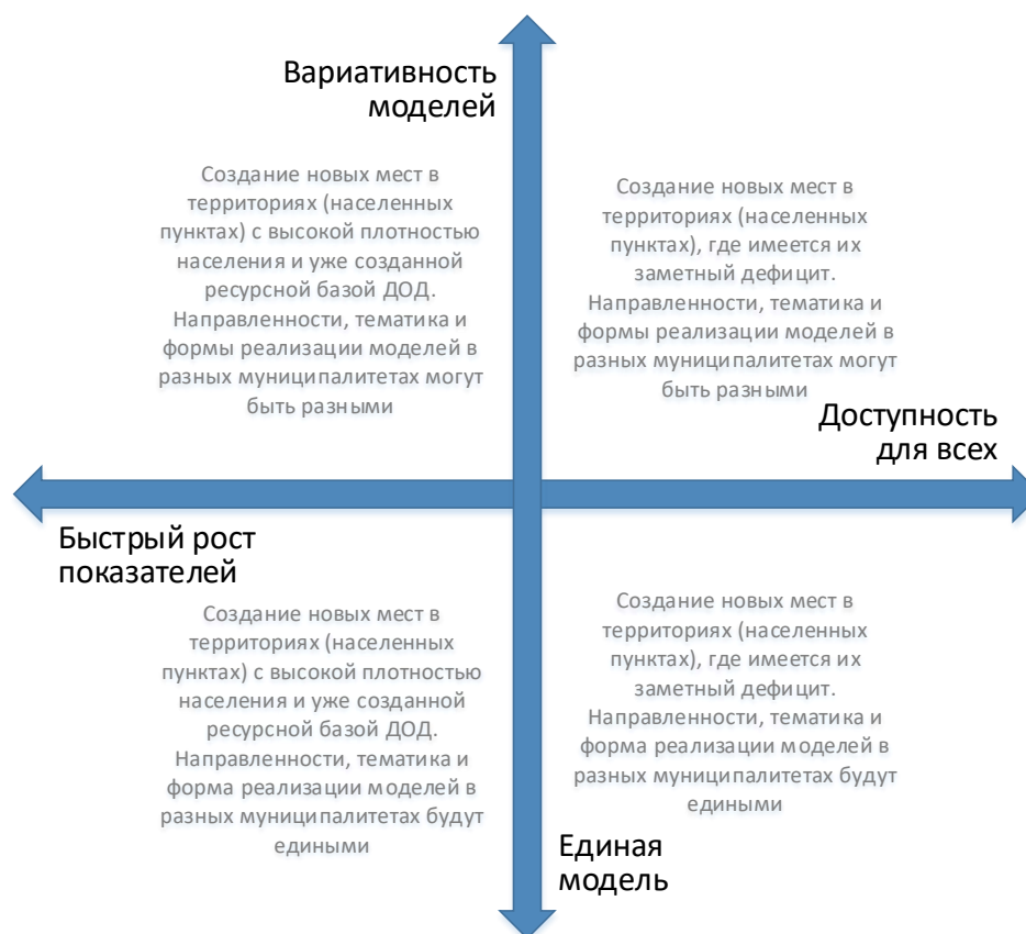
Рис. 4. Шкалы выбора модели создания новых мест с учетом актуальной управленческой политики