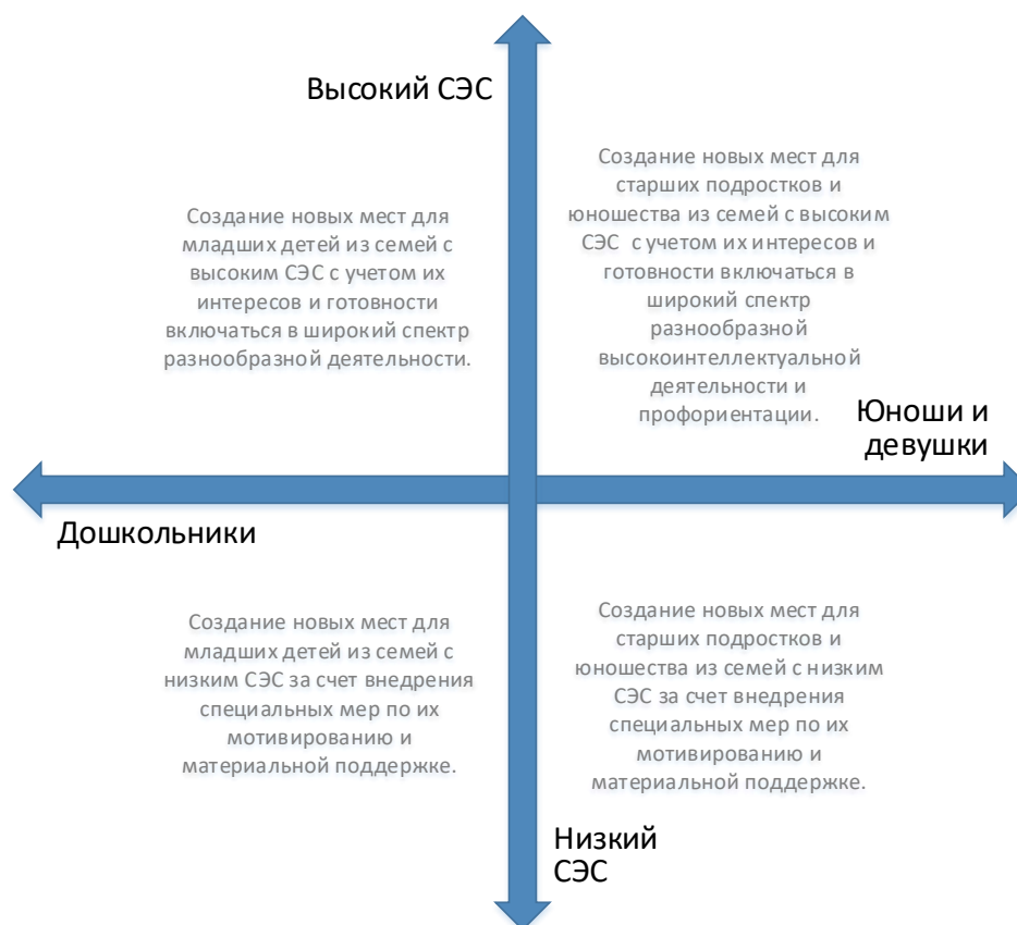
Рис. 5. Шкалы выбора модели создания новых мест по программам естественнонаучной направленности с учетом особенностей контингента обучающихся

Вовлечение в программы детей из семей с низким образовательным и культурным уровнем потребует осуществления определенных PR-шагов, поиска мотиваторов для данных детей, в том числе материальных.