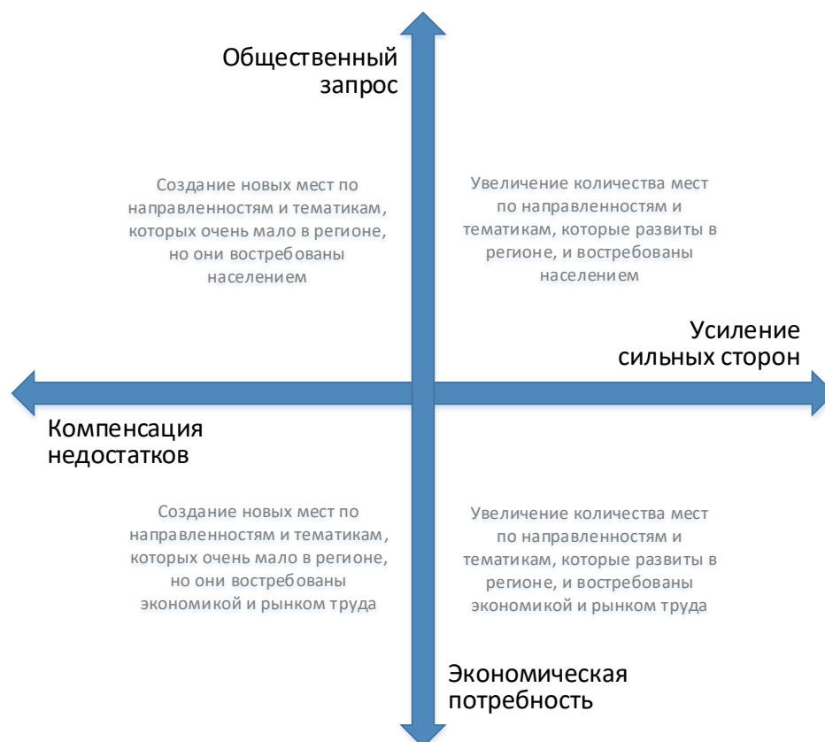
Рис. 2. Шкалы выбора тематики и тактики создания новых мест дополнительного образования