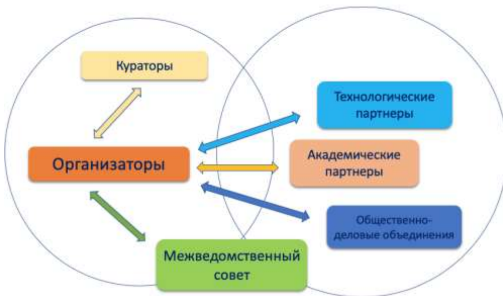
Рис. 1. Схема взаимодействия участников мероприятий по внедрению и функционированию типовой модели «Диалог наук»

Схема взаимодействия участников мероприятий по внедрению и функционированию типовой модели «Диалог наук» приведена на рис. 1.